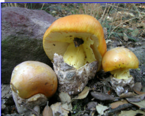
Amanita caesarea