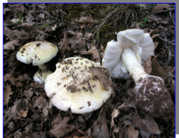
Amanita phalloides